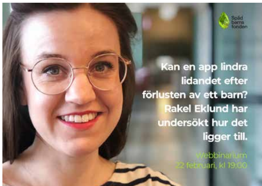
Webinarium om sorgeappen för våra medlemmar.