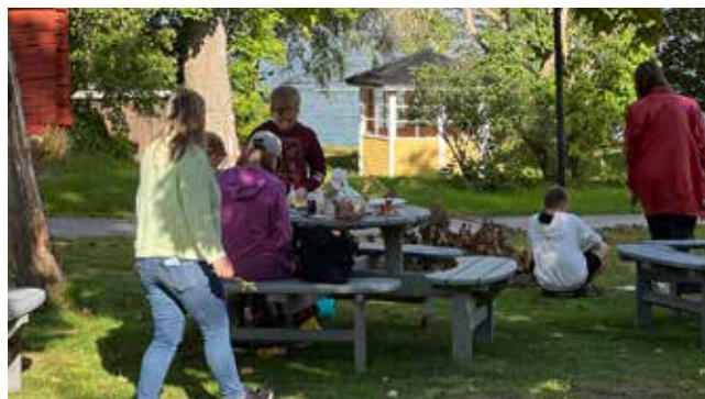
På familjehelgerna delas unik gemenskap, läkande samtal, medmänskligt stöd, vila och eftertanke