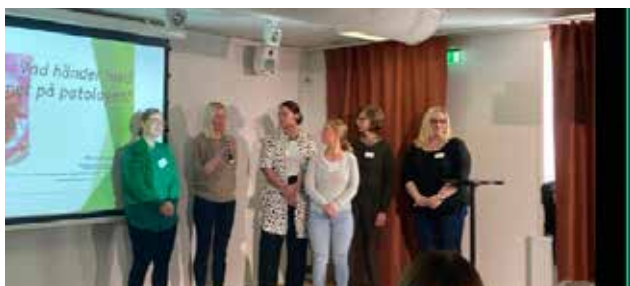
Patologen från Huddinge sjukhus föreläste.