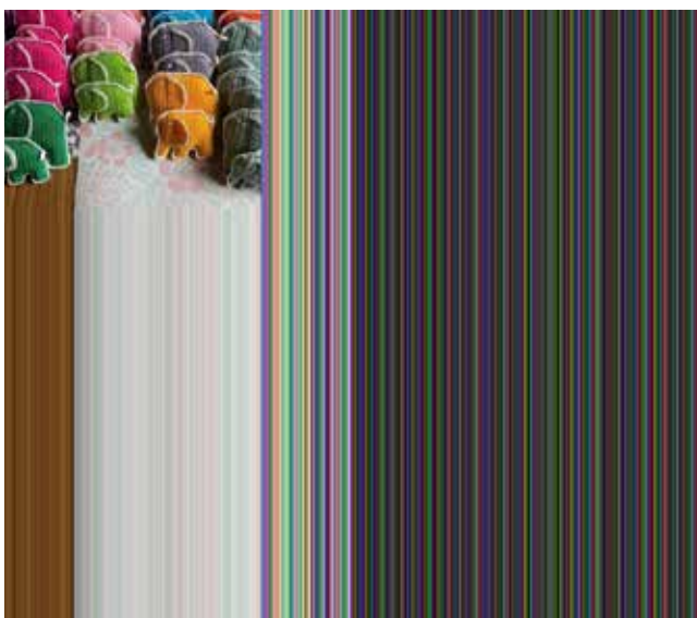
I minnespåsen finns bland annat två handvirkade elefanter. En som får följa med barnet i kistan och en att ta med hem.