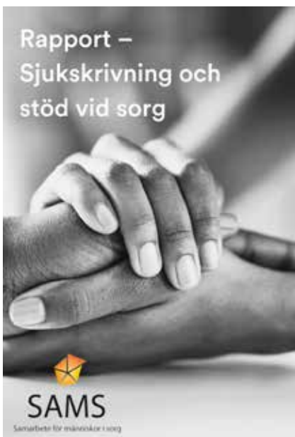
Spädbarnsfondens är med i rapporten.