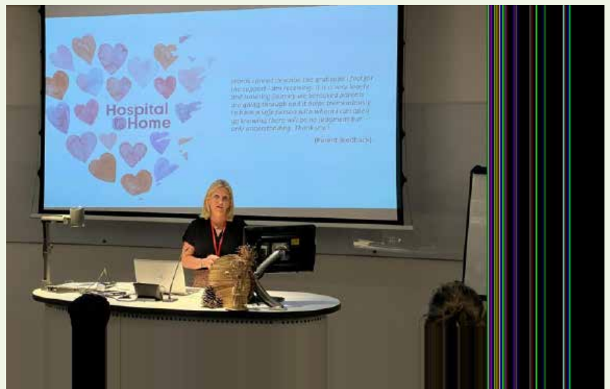
Angelägna föreläsningar varvas med möjlighet att ta del av varandras kunskap, både i form av material och möten.

– Jag känner mig även väldigt inspirerad när det kommer till att uppdatera våra Minnespåsar och att än mer försöka nå ut med information till sjukhusen med vad som är bra att tänka på när man har hand om sörjande föräldrar. Jag hoppas att vi under ISA har lyckats nätverka och knyta kontakter så att vi framöver har möjlighet att bjuda in intressanta föreläsare som kan bidra med sin kunskap.