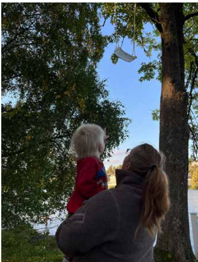
Glasgungan 'Hålla' av Vilda Kvist är ett konstverk som hyllar och synliggör gränslandet mellan sorg och kärlek.