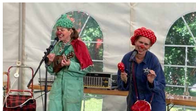
Clowner som får alla att skratta är otroligt uppskattat på en familjehelg.