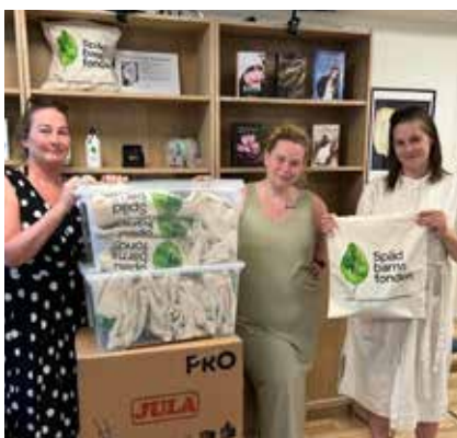
Ideella packar minnespåsar i lokalen på Tantogatan.