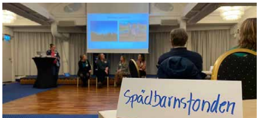
PÅ SAMS utbildningsdagar höll representanter från Spädbarnsfonden ett panel-samtal om syskons sorg och ritualer.